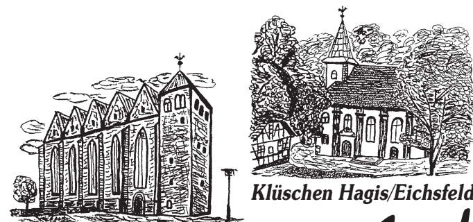
Magdeburg - St. Petri

Offenheit und gegenseitige Hilfe, gemeinsam durchzustandene Strapazen sowie die Bereitschaft einander anzunehmen und aufeinander zuzugehen, schaffen Einheit im Geiste des Herrn. In diesem Geist finden hier auch Pilger verschiedener Konfessionen zusammen. So wird diese Wallfahrt zum Glaubenszeugnis füreinander und für alle, die den Wallfahrtsgruppen auf ihrem Weg begegnen. Friede und Versöhnung werden gelebt als Zeichen der Hoffnung auf eine versöhnte Welt.