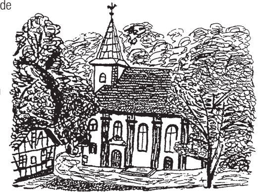
Klüschen Hagis / Eichsfeld

Zugfahrt "E-Gruppe" Fußweg "M-Gruppe" Fußweg "E-Gruppe"