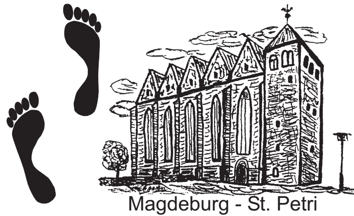
Magdeburg - St. Petri