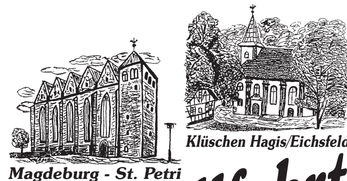
Magdeburg - St. Petri

Offenheit und gegenseitige Hilfe, gemeinsam durchzustandene Strapazen sowie die Bereitschaft einander anzunehmen und aufeinander zuzugehen, schaffen Einheit im Geiste des Herrn. In diesem Geist finden hier auch Pilger verschiedener Konfessionen zusammen. So wird diese Wallfahrt zum Glaubenszeugnis für einander und für alle, die den Wallfahrtsgruppen auf ihrem Weg begegnen. Friede und Versöhnung werden gelebt als Zeichen der Hoffnung auf eine versöhnte Welt.